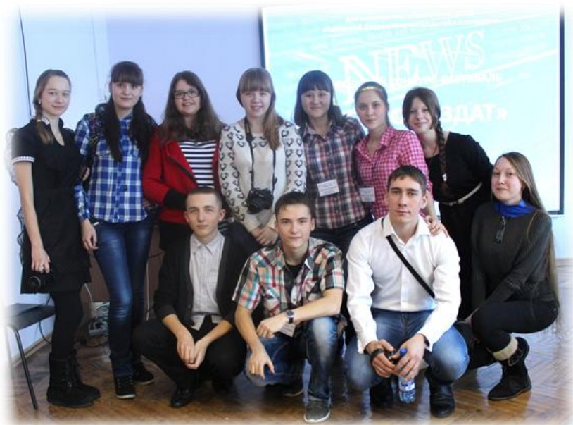
Корреспонденты школьной газеты «Пластилинное небо» - трижды победители городского конкурса школьных пресс-центров

Она скоро заснет. А он продолжит свою незамысловатую мелодию, смотря на небо. Может, все-таки углядит чудо это?