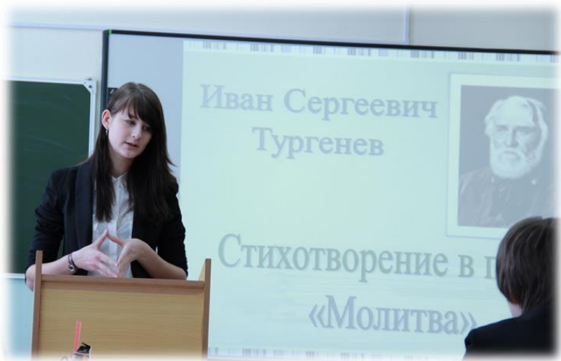
ВЫСТУПЛЕНИЕ НА ЧИТАТЕЛЬСКОЙ КОНФЕРЕНЦИИ «ТАЙНА ПОЭЗИИ, ЖИЗНИ, ЛЮБВИ»

И в заключение, я могу сказать, что для тех, кто до сих пор не решил, в какой профиль ему податься, необходимо крайне внимательно подумать над этим вопросом. Может показаться, что добавление несколько новых часов к предмету не изменят большой погоды, однако это не так. Если вы выберете профиль, который подойдет для вас наилучшим образом, то он может очень сильно повлиять на ваше дальнейшее будущее.