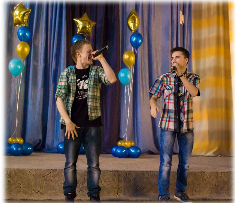
ШКОЛЬНЫЙ АРТИСТ - 2014