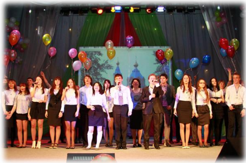
ПОБЕДИТЕЛИ ГОРОДСКОГО КОНКУРСА «КЛАСС ГОДА – 2013»