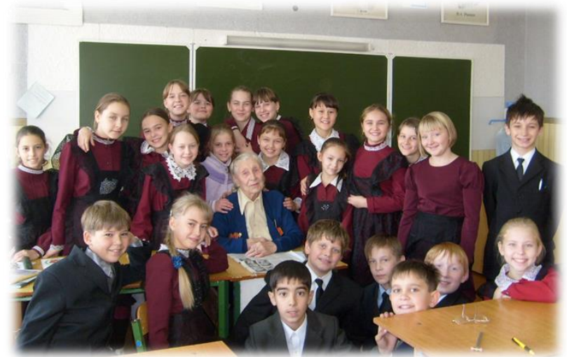
СЕМЬЯ ПОД НАЗВАНЬЕМ «11 А»

Как и любой праздник, день поэзии начинался с часа-пика. Час-пик – это утреннее мероприятие, где идет погружение в творческий день, и рассказывается план на день, что где будет проходить, какие мероприятия ожидают нашу публику. Конечно, целый день я должен быть в образе, поэтому я был Есениным. На самом деле я хотел быть Фетом, но в костюмерной не было его костюма. Так вот, после погружения мы готовились на вечернее, наше главное мероприятие, которое называлась „Поэтическая дуэль”. Мероприятие это заключалось в том, что каждое агентство должно было приготовить творчество поэта в современном виде, то есть осовременить поэта. Для этого на летучке (заседании ОСУ (органов самоуправления), куда входили два человека от отряда) проводилась также жеребьевка, где ребята вытягивали определенного поэта, будь то Барто, Чуковский, Есенин и т. д., и должны были переделать его стих и, конечно же, ознакомиться с его творчеством. Вечером эти номера были представлены на сцене, где наших творческих работников праздничных агентств оценивало жюри. И так проходил каждый праздник. Одно агентство давало нам каждый вечер задание, которое выполнялось в течение дня, и которое