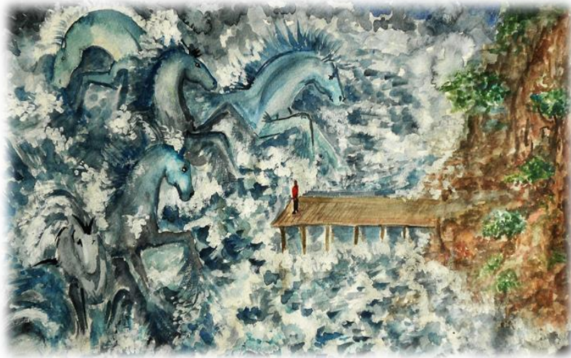
Художник ИАНА ЛЕПЕХОВА