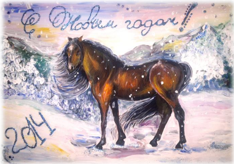
Художник КАРИНА ЛАЗАРЕВА