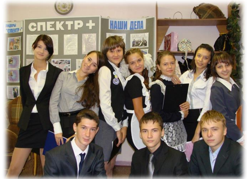
СУДЬБА НАС ВМЕСТЕ СОБРАЛА

Быть может, кто-то ядовитую обиду затаил, Прошу простить его. Желая, Чтоб зла мы друг на друга не держали, И в будущее с добрыми надеждами вступали, Чтоб золотые помысли не пряча, На дне души их не скрывали.